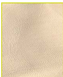
Forro Vegetal cor natural